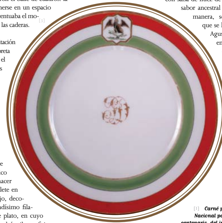
[1] Carné para el baile en el Palacio Nacional para los festejos del primer centenario del inicio de la Independencia de México

manera, se recordaba el festín que se le ofreció al emperador Agustín de Iturbide en su entrada triunfal a la Ciudad de México y los vivos colores que el Ejército Trigarante legó a México. En aquella fiesta para celebrar un siglo del inicio de la Independencia, resonaron las palabras del mismo Iturbide: Ya os he enseñado el modo de ser libres, corresponde a vosotros encontrar el de ser felices.