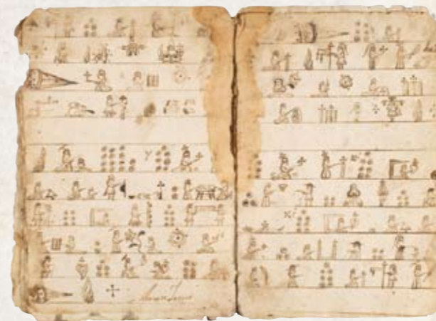
Catecismo Testeriano | Siglo XVI | FONDO DCCCLXXXIX | Col. Centro de Estudios de Historia de México CONDUMEX

De acuerdo con los grandes procesos nacionales, se conforma una muestra que expone testimonios de Mesoamérica, el Nuevo Mundo, la Conquista, el virreinato, los siglos XIX y XX y la era contemporánea.