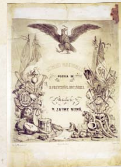
Primera edición del Himno Nacional Mexicano. Poesía de don Francisco González Bocanegra Música de don Jaime Nunó | México, 1854 | Litografía de Manuel Murguía y Hesiquio Iriarte | 35.8 x 26.3 cm

Edmundo O'Gorman apuntaba que un texto es por excelencia el depositario de los anhelos de un pueblo . Museo Soumaya, a partir del 8 de septiembre y hasta el domingo 30 de octubre, exhibirá esta espléndida muestra de textos, planos y fotografías, además de otros objetos de la historia artística nacional. Los Tesoros de papel guiarán a los visitantes entre el pasado y el presente, para comprender la importancia del ser mexicano.