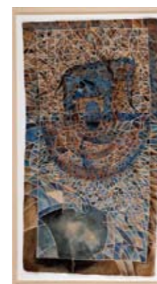
Francisco Toledo | Elejante | c. 1978 | Gouache y collage sobre papel amate | 79 x 41.7 cm