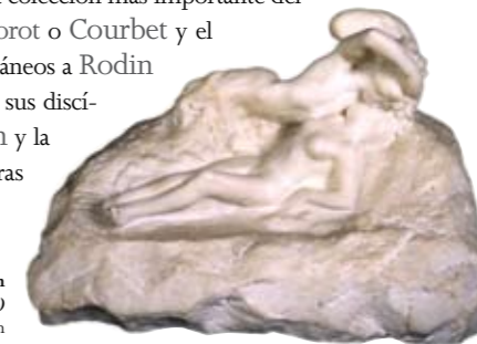
Auguste Rodin | El beso del fantasma y la doncella (o El Sueño) | 1880 | Marmol blanco | 31 x 49.3 x 27.9 cm

Rodin llevó la escultura hacia la modernidad con formas libres y expresivas. La colección más importante del autor fuera de Francia, nos lleva por un viaje a través del Romanticismo de Corot o Courbet y el Impresionismo de Monet, Pissarro, Degas, Renoir. Precursores y contemporáneos a Rodin como Daumier, Carpeaux y Carrier-Belleuse comparten el espacio con sus discípulos Camille Claudel y Bourdelle y los grandes maestros hasta Gauguin y la primera época de Van Gogh. Las vanguardias en el arte se muestran con pinturas y esculturas de Picasso, Dufy, Chagall, Miró, Ernst, Vlaminck y Dalí.