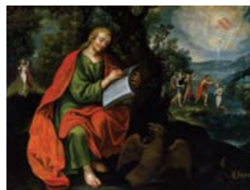
Juan Sánchez Salmerón | San Juan Evangelista | Fines del siglo XVII | Óleo sobre lienzo | 84 x 112 cm