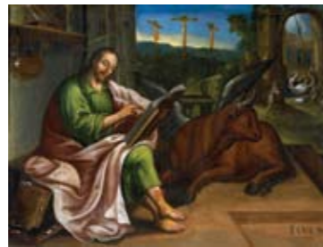
Juan Sánchez Salmerón | San Lucas Evangelista | Fines del siglo XVII | Óleo sobre lienzo | 84 x 112 cm