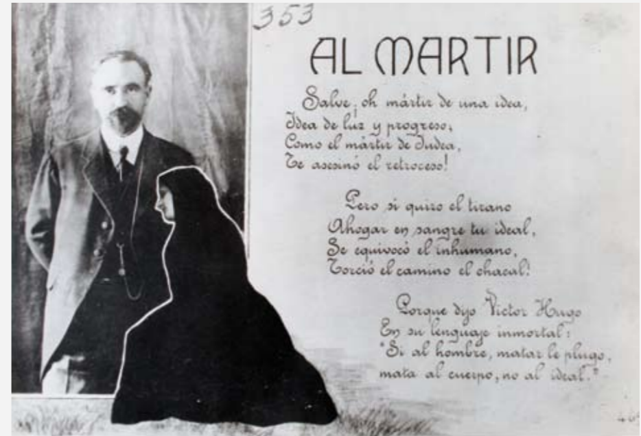
Al mártir | Sin fecha | Plata sobre gelatina | Colección de fotografías del siglo XX. "Personajes notables de la Revolución", Número 396, Fondos LXVI, CCXXIV, CCXLV y DLXVII y CMLXI