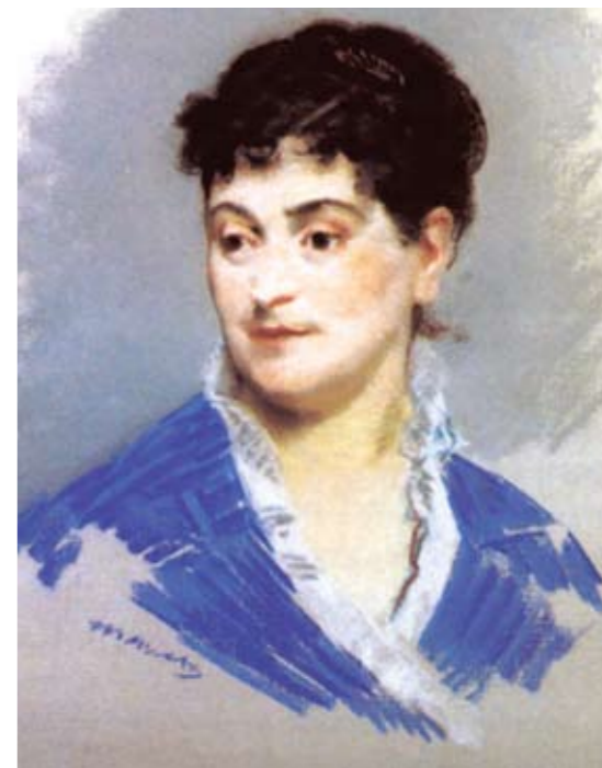
Édouard Manet | Retrato de Mme Émile Zola | 1879 | Pastel sobre lienzo | 52 x 44 cm | Museo d'Orsay, París

Es probable que el espíritu decadente asociado con el movimiento estético simbolista de fines del siglo XIX, en Francia, se haya encarnado en el rostro azucarado, impersonal y un tanto convencional, de La Parisina . En una palabra, puede detectarse en su semblante, la idealización de una mujer que siempre será joven; de un imperativo de espiritualización que las sensaciones humanas –reflejos del universo– entonces hayan producido; y, finalmente, de un prototipo –de índole emblemática– del eterno femenino.