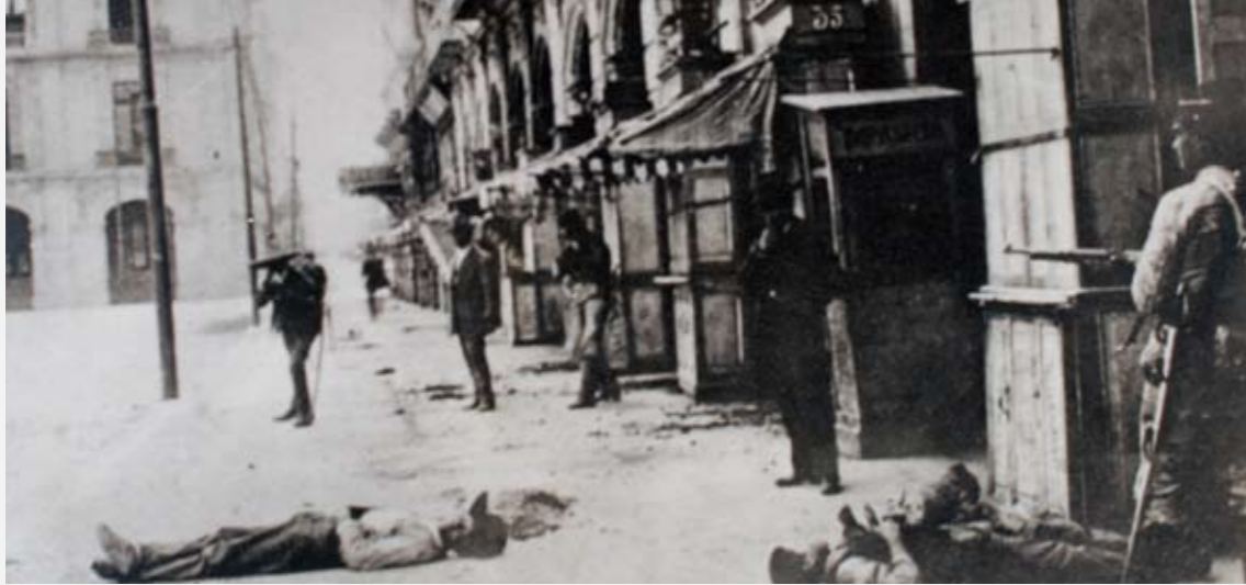
Anónimo | Zócalo durante los días de la decena trágica | 9-19 de febrero de 1913 | Plata sobre gelatina | Reprografía | Colección de fotografías del siglo XX. "Personajes notables de la Revolución", Número 394, Fondos LXVI, CCXXIV, CCXLV y DLXVII y CMLXI

la capital, horrorizó a sus habitantes, probó la ineffectividad del gobierno y dio paso al golpe final contra Madero.