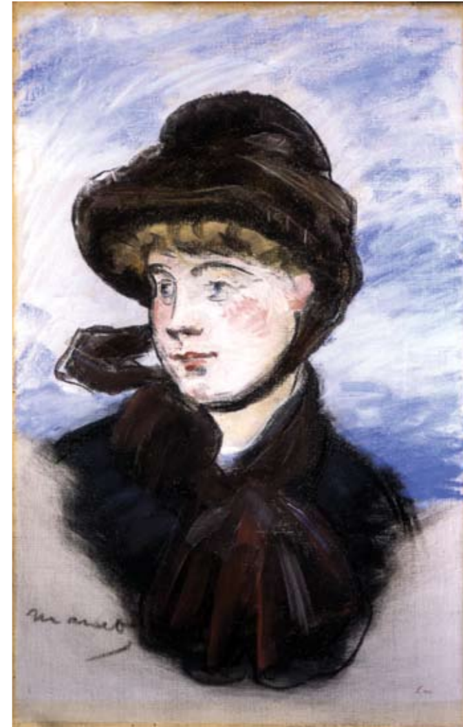
Édouard Manet | Una parisina (o Mujer con sombrero café) | 1882 | Pastel sobre lienzo | 55.3 x 35.5 cm

No está de más subrayar la economía de dibujo en todo el diseño claroscuro de la obra; sea en la condición lineal de las facciones de la veinteañera o en el trazado fugaz del firmamento que bordea a la Parisina , resuelto en movimientos francos de blanco y azul. Esa fluidez técnica produce una sensación de ingravidez. En sentido contrario y con