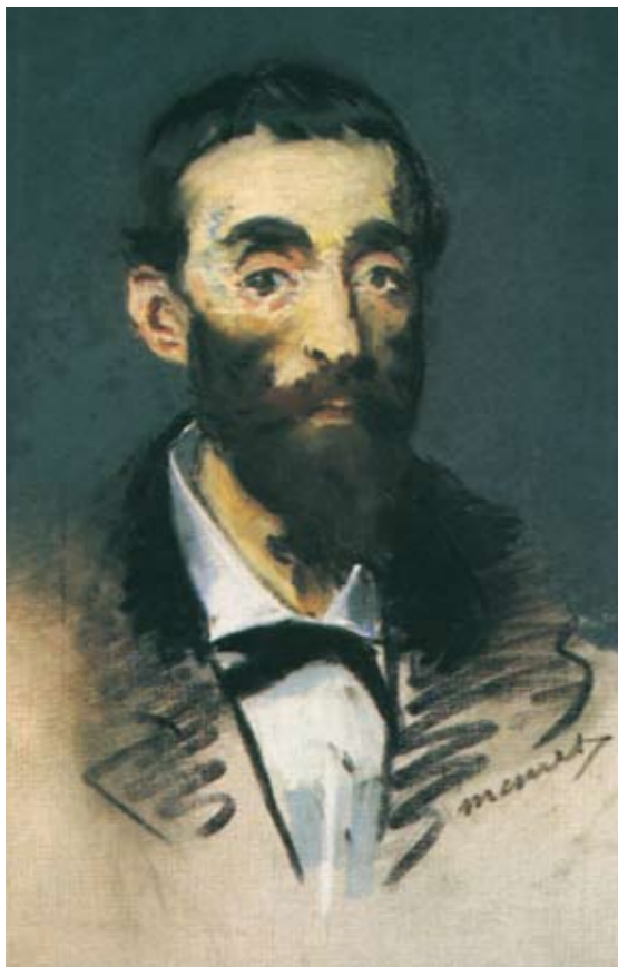
Édouard Manet | Retrato de Cabaner | C. 1880-81 | Pastel sobre lienzo | 53.7 x 35 cm | Museo d'Orsay, París

independencia del tono sombrío del abrigo y del sombrero, la inflexión reiterativa de color en esas áreas, otorga al busto femenino una densidad tangible y bidimensional; todo solucionado, mediante procesos diversos de factura y de conformidad a cada sección del retrato.