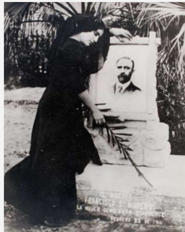
Al mártir Francisco I. Madero | 23 de febrero de 1914 | Plata sobre gelatina | Reprografía | Del Archivo Casasola en la colección de fotografías del siglo XX. “Personajes notables de la Revolución”, Número 397, Fondos LXVI, CCXXIV, CCXLV y DLXVII y CMLXI

Trágico, desolador aspecto presentaba el Zócalo durante los días de la decena trágica. Frente al portal de mercaderes, sobre la banqueta, hay varios civiles muertos en el tiroteo; mientras soldados de línea y algunos “rurales” disparan sus armas. La metrópoli vivió entonces horas de angustia y dolor.