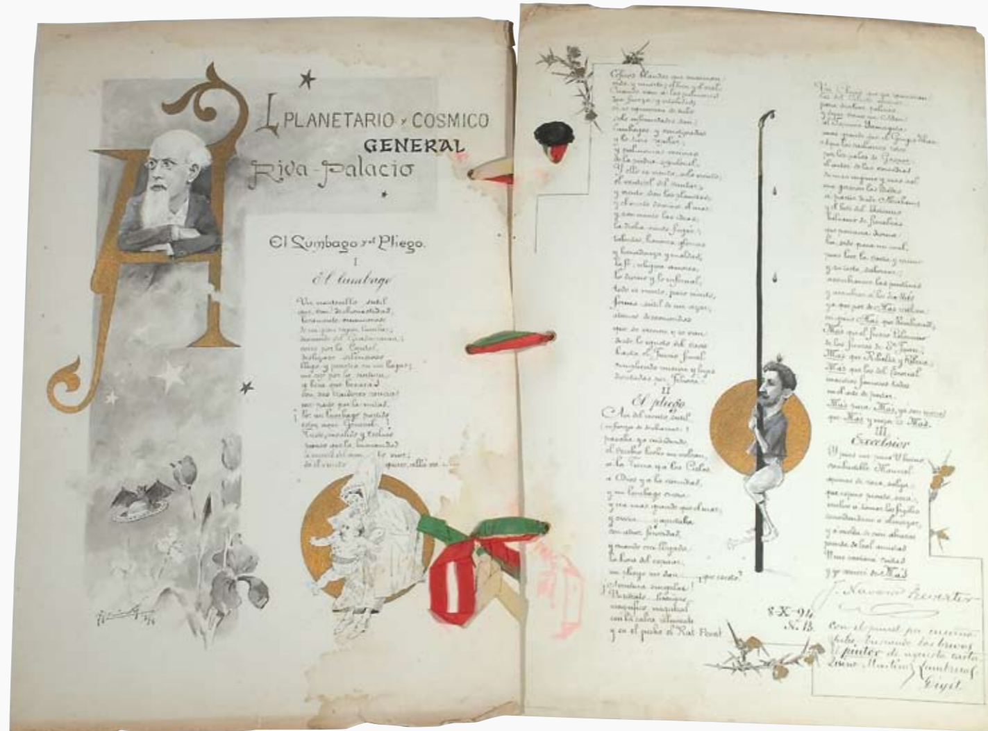
J. Navarro Reverter | Poema Al planetario y cósmico general Riva Palacio | 1894 | Fondo DCXCIII, Colección Adquisiciones Diversas | Centro de Estudios de Historia de México Condumex